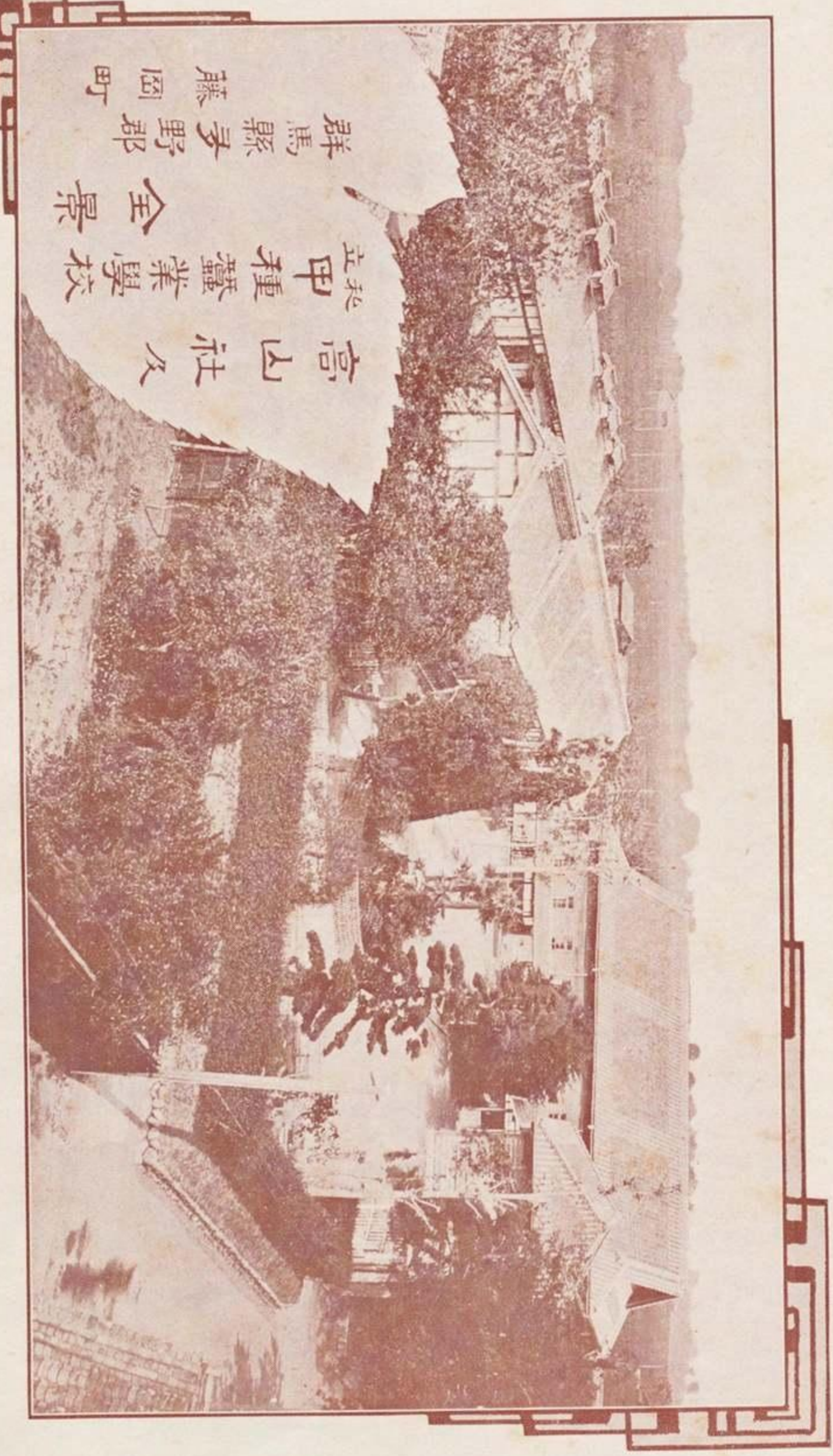
高山社久 立甲種蠶業學校 全 景 群馬縣茅野郡 藤岡町