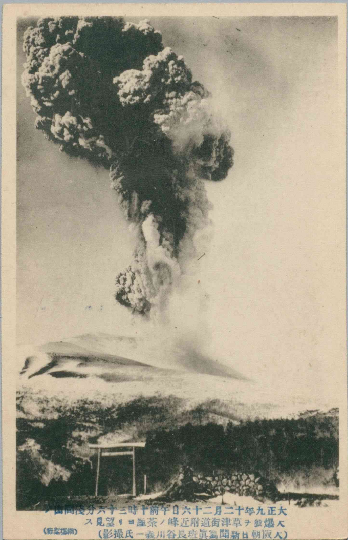
大正九年十二月二十六日午前十時三十分六分淺岡山 大爆ノ草津街附近ノ茶屋ヨリ望見ス