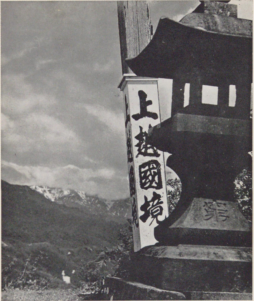
(影撮氏郎太保良奈)